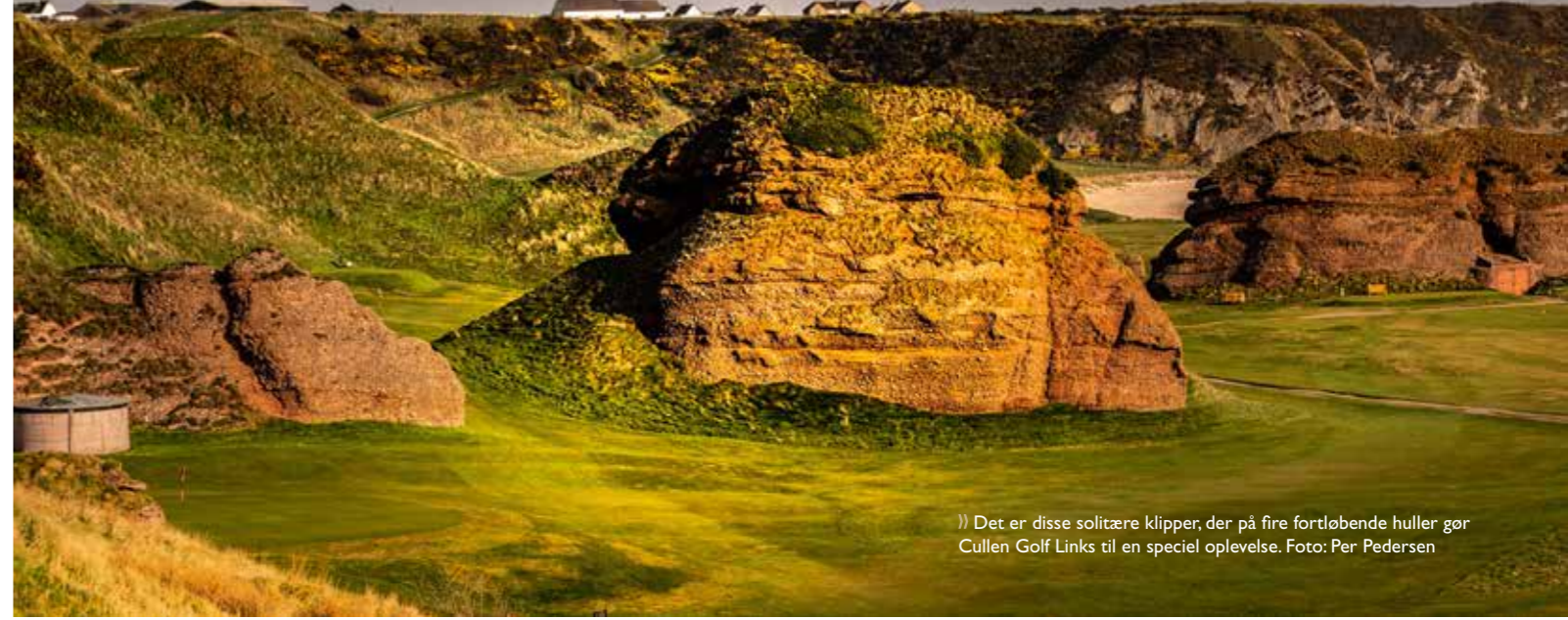
» Det er disse solitære klipper, der på fire fortløbende huller gør Cullen Golf Links til en speciel oplevelse.

Golfdestinationen over alle i Speyside hedder uden sammenligning Moray Golf Club i Lossiemouth, hvor der i 1889 med føromtalt legendariske Old Tom Morris som arkitekt blev åbnet en 9 hullers-bane, som to år senere blev udvidet til 18 huller. I 1905 blev en 9 hullers Ladies Course indviet, og den bestod faktisk indtil 1979, hvor Sir Henry Cotton, en legendarisk englænder som både spiller og banearkitekt, implementerede Ladies Course i endnu en 18 hullers-bane. Siden har de to baner heddet henholdsvis Old Course og New Course.